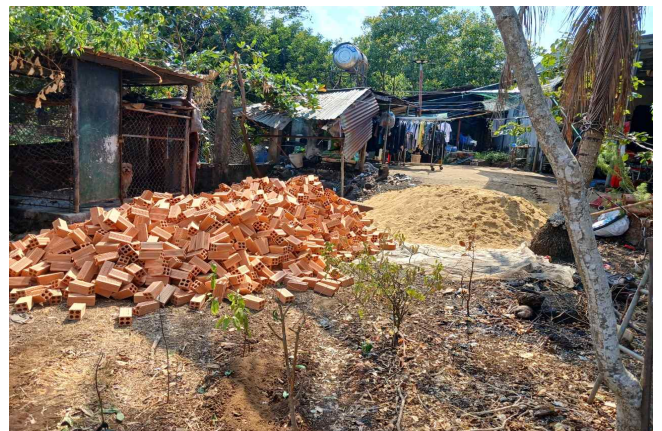
<동나이 교회 화장실 및 샤워실 신축 공사 자재>