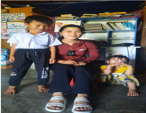
<Tuvan 목사님과 사모님, 아이들 신발과 옷>

특별히 감사할 것은 닥농교회 사모님과 아이들에게 염소 분양을 통해 생활비를 지원해 필요한 옷과 신발을 사 드렸습니다. 하나님 나라를 위해 고군분투 하시는 베트남 목사님과 가정들이 조금이라고 힘을 얻으면 좋겠습니다.